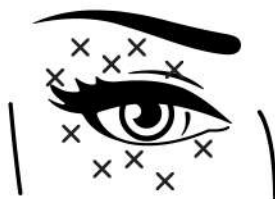
0,05 ml Rys. 1