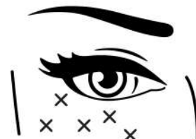
0,1 ml Rys. 2

UWAGA! Preparat nie jest przeznaczony do iniekcji w inne miejsca niż skóra właściwa.