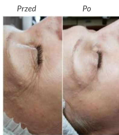
Kobieta 61 lat