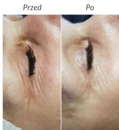
Kobieta 50 lat

Zaobserwowano również, że polinukleotydy mają pozytywny wpływ na teksturę i koloryt skóry. Wszyscy ochotnicy byli skłonni powtórzyć serię zabiegów preparatem HP VITARAN.